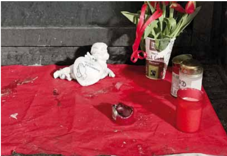
Immer wieder erinnern kleine Denkmäler in Bremen an verstorbene Obdachlose.

Trinkwasserbrunnen zum Beispiel. Mit seinem langen, weißen Bart – wie der Weihnachtsmann – saß er oft in der Nähe der Hillmann-Platzes und las. „Viele historische Romane“, sagt Schröder. „Je dicker, desto besser“. Und Bukowski vor allem, den amerikanischen Dichter mochte er besonders. Doch selbst wer ihn kannte, weiß nicht viel von seinem früheren Leben. Darüber kursieren mehrere Geschichten, von denen man nicht so genau weiß, welche stimmt. Bekannte sagen, er sei technisch versiert gewesen, habe wahrscheinlich ein Ingenieurstudium hinter sich gehabt. Wie er auf die Straße kam, das hat er nie öffentlich verraten. Und wer es weiß, respektiert seinen Wunsch nach Schweigen.