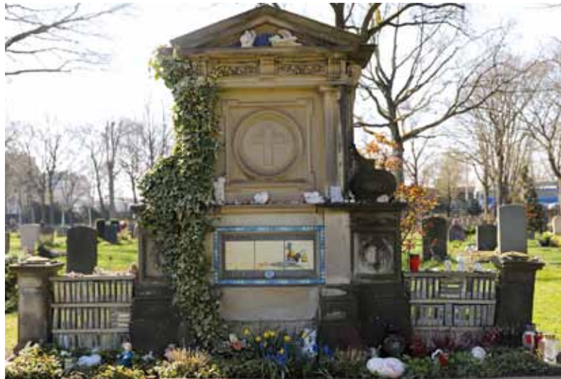
Dieses Grab im Waller Friedhof erinnert an verstorbene Obdachlose in Bremen.

Nicht jeder mochte ihn. Ein Mann, den die Straße erhärtet hatte, sagt einer. Ein Mann, der klar in seinen Aussagen und Abgrenzungen war, sagt ein anderer. Der wusste, mit wem er zu tun haben wollte und mit wem nicht. Einer, der gern zusammen mit anderen war, aber auch Rückzug brauchte. Aber selbst wer sich mit ihm nicht verstanden hat, bestätigt: Wer einen Rat suchte, den fand er bei ihm. „Er hat sehr viel gewusst“, so ein Bekannter. Auch einer, der immer wieder versucht hat, zurückzugehen zum „Ufer der Normalität“, was auch immer das ist. Sein Leben ist das Leben eines Menschen, der sich nie geschlagen gegeben hat. Ein Selbstbestimmter. Ein Kämpfer. Einer, der nicht aufgegeben hat. Bis er doch aufgab.