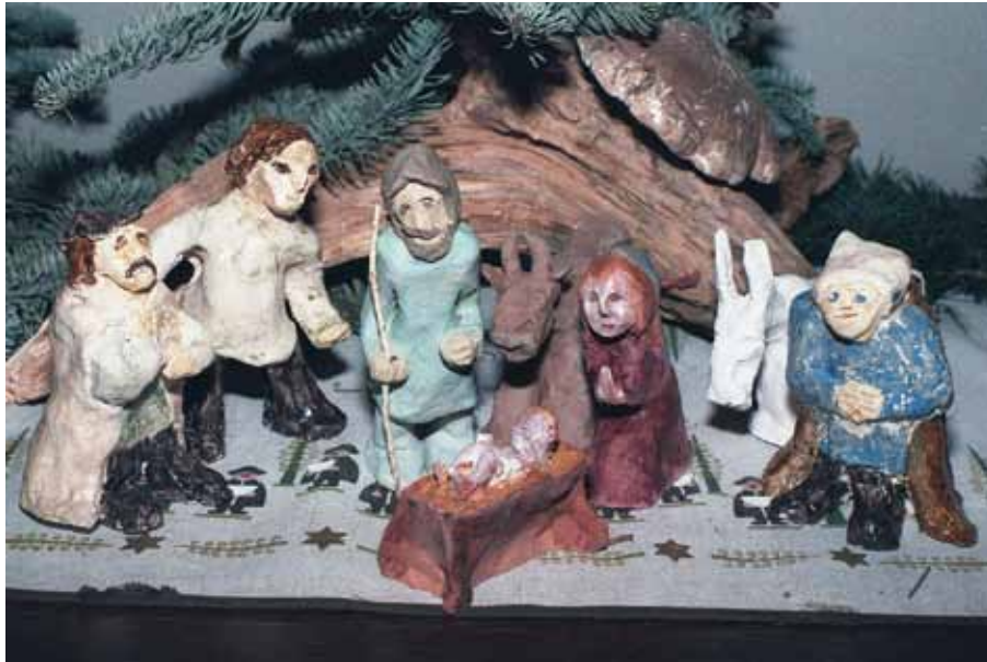
Krippe Veronica Meyer-Haus Salem

zu und konnten angesichts der drei Elenden solche Sorglosigkeit fast nicht verstehen. Grenzte diese Verschwendung nicht an Beraubung des Kindes?